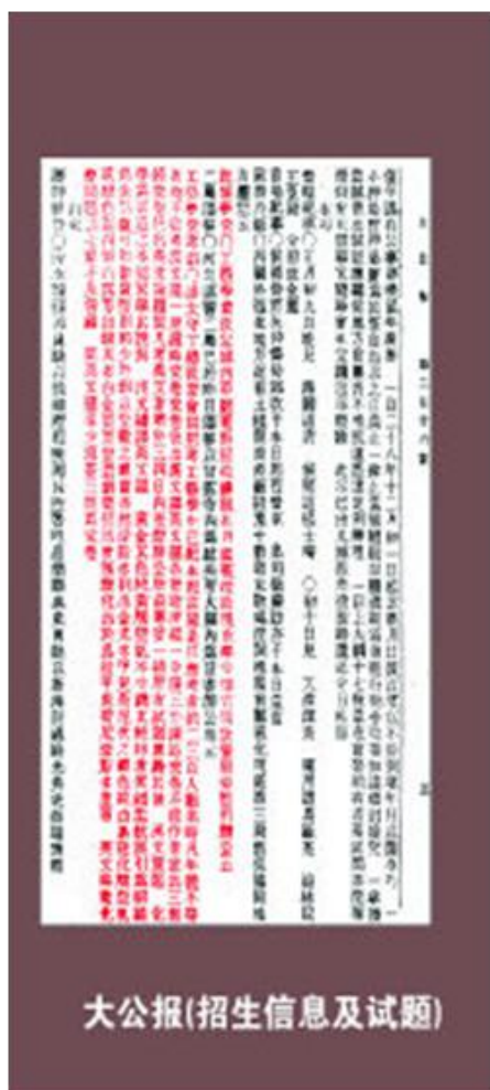
北洋工艺学堂的招考试题在《大公报》上刊登

考试也很独特，汉文主要是写作，相当于现在写的论文，题目是《化学为制造之根本》，要求考生能略举其说。汉文译英文也与化学科学相关，其中有一段话是这样的：“黄金其色纯黄，触空气不生锈。其纯粹者质颇柔软，可展引为细线，为金