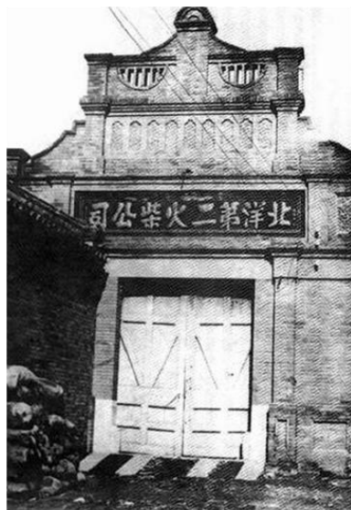
北洋第二火柴公司外景

津“城厢内外创设工学堂（河北工业大学前身），以精其理法；设实习工厂，以练习其技能”。 1