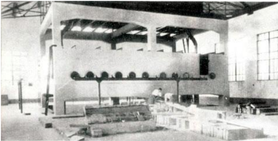
中国第一水工试验所的主体设施

中国第一水工试验所是中国第一个现代水利科研机构，第一个国家级实验室，也是最早的中国水利科学研究机构。该试验所奠定了中国现代科学治水的基础，也标志着现代水利科学研究技术手段在中国落地生根，是中国水利由传统的经验型水利转变为现代水利的里程碑。